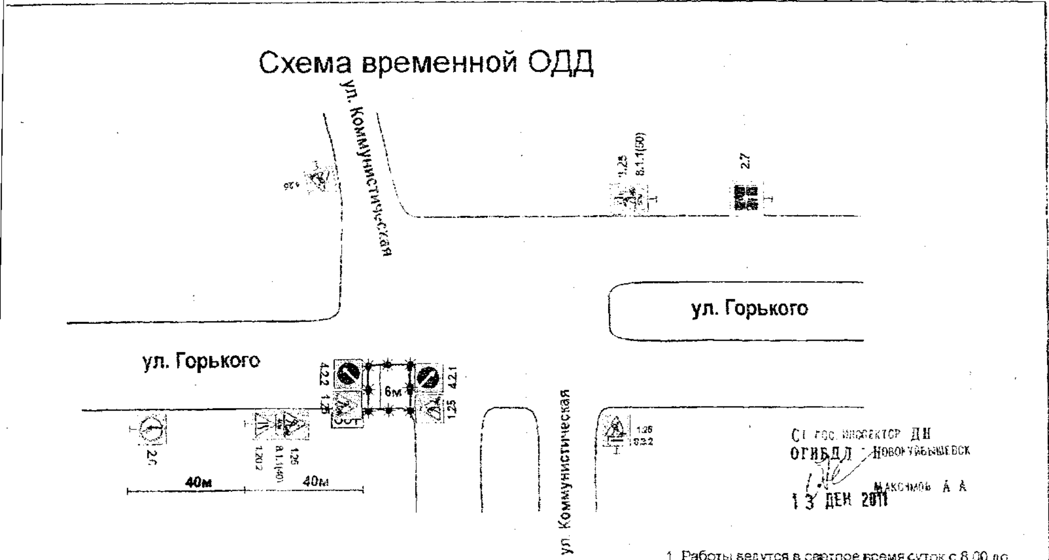
Схема временной ОДД

СИ ГОС. ИНСПЕКТОР ДИ ОГИБДД - НОВОУБЫШЕВСК МАКСИМОВ А А 13 ДЕН 2011